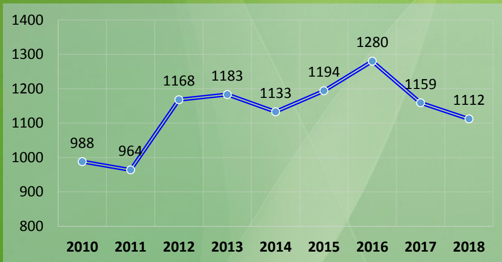
Динаміка кількості хворих з уперше в житті встановленим діагнозом активного туберкульозу