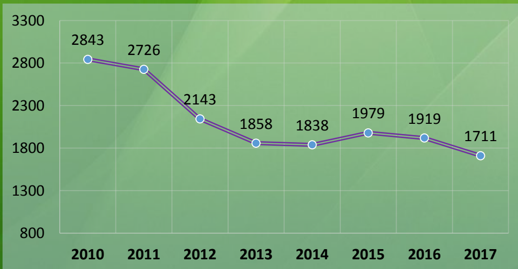
Динаміка кількості хворих з діагнозом активного туберкульозу, які перебували на обліку у медичних закладах, на кінець року