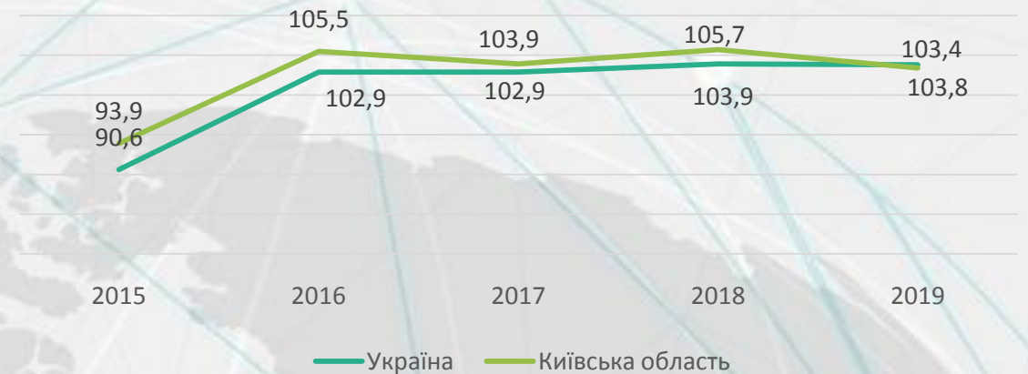
Індекс фізичного обсягу валового регіонального продукту у розрахунку на одну особу, у цінах попереднього року, відсотках

У 2019 році Київська область посіла 4 місце серед регіонів України з часткою валового регіонального продукту 5,5 %